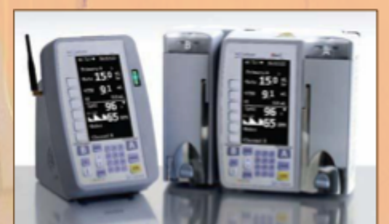
Bomba de infusión

En el caso de los menores de un año, el Celador-Asistente traslada al menor a pediatría para canalizarle un acceso venoso.