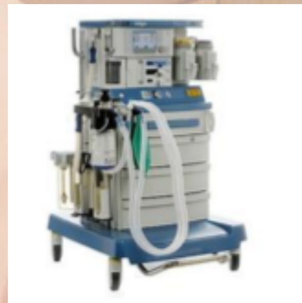
Equipo de constantes